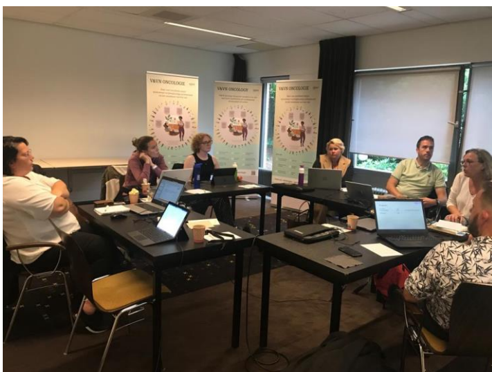
Foto: bestuur en ondersteuning bestuur Beleidsdagen oktober 2023

Tot slot werd de koers, de visie en missie van V&VN Oncologie door het bestuur en de ondersteuning van het bestuur besproken tijdens de fysieke beleidsdag te Doorn op 11 oktober 2023.